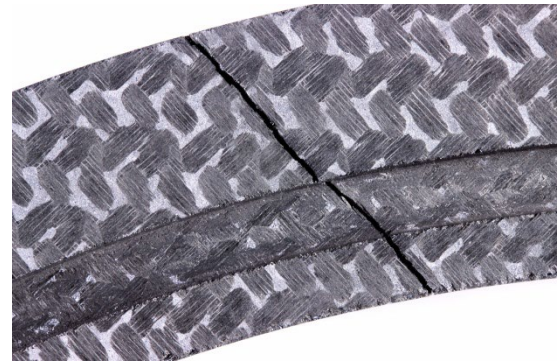
Bruch in einem kohlefaserverstärktem Bauteil