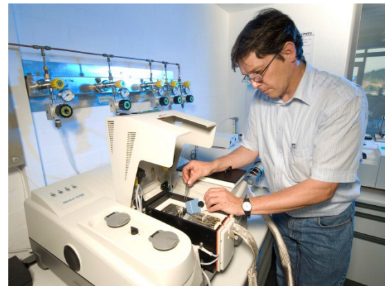
Fouriertransformierte Infrarotspektroskopie (FTIR)